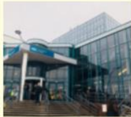
L'université de Derby