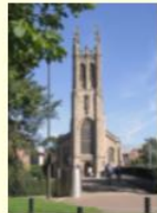
L'église St. Marie